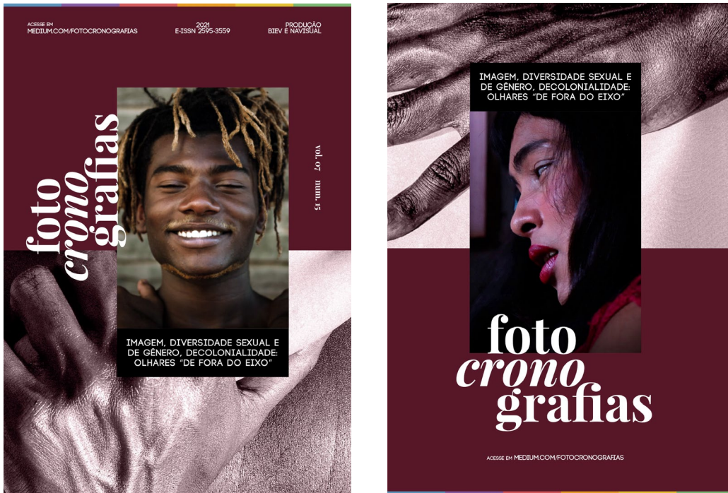
Imagem 3 - Fotografias em mosaico apresentadas na

Imagem 1 e 2 - Respectivamente, capa e contracapa do v. 7, n. 15 da revista Fotocronografias.